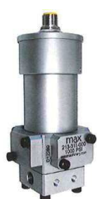
流量検出器 (標準タイプ)