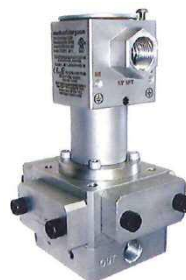
防爆検出器タイプ (オプション)